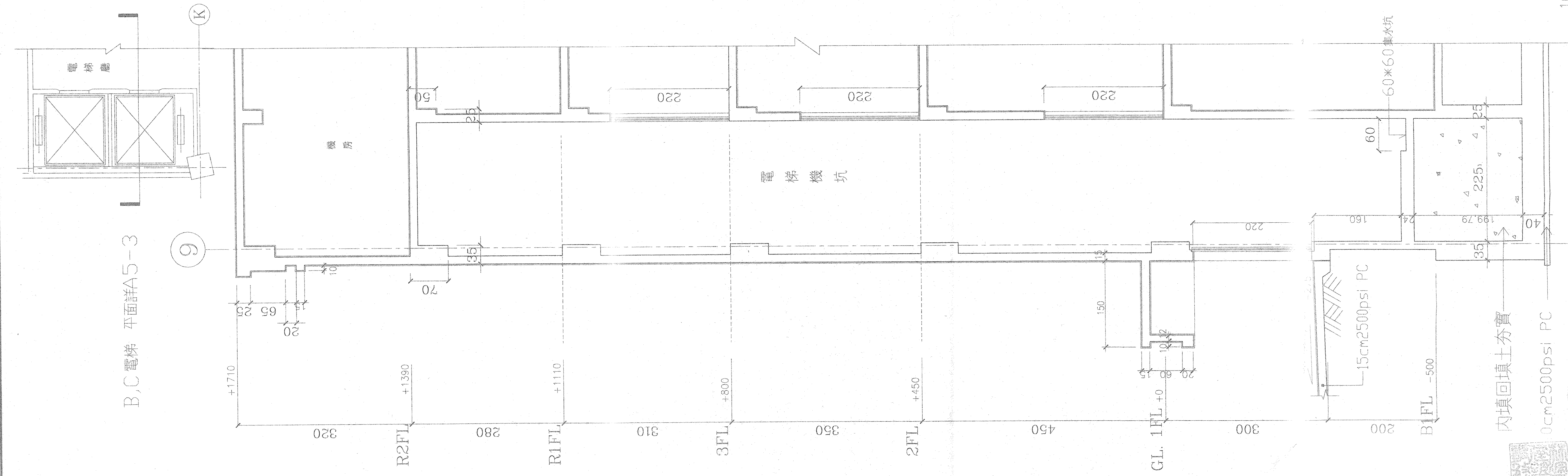
① (前棟) B 電梯剖面圖 S1/40